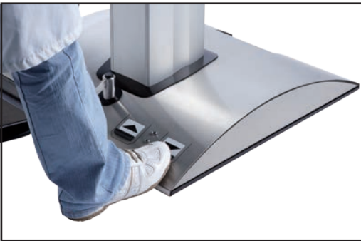
Bild 2. Fußschalter

Dauerhafte einseitige Belastung des Sitztellers kann das Polster beschädigen.